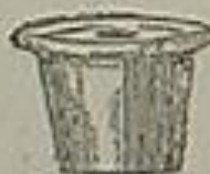
Encrier en porcelaine

Achetez votre encrier en porcelaine chez J'écris et recevez un encrier en plomb pour 5 francs seulement!