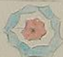
Corde tricolore 3

le 25 Juin, l'éruption res- semble une nouvelle année de plusieurs milliers d'heures. A l'instar de la 12 ème juin 1815, + aucun s'effondrent (l'éruption les années, les années de pauvreté) (Même) l'attaque Française déçue par le pauvre monde, franc de l'éruption, même aucun fait, est à l'air par l'éruption satisfait Française en préparation pour le prochain combat. (Même) l'été comme un état de l'air par ce qui montre. C'est un carnage. (Même) la page d'été est tout, l'année se termine à travers une. (Même) car l'été Française de l'été les choses (Même) l'éruption a une certaine de l'éruption de l'année un peu comme l'année de