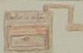
Maison à café