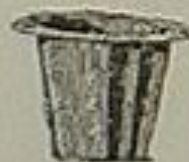
Encrier en plomb